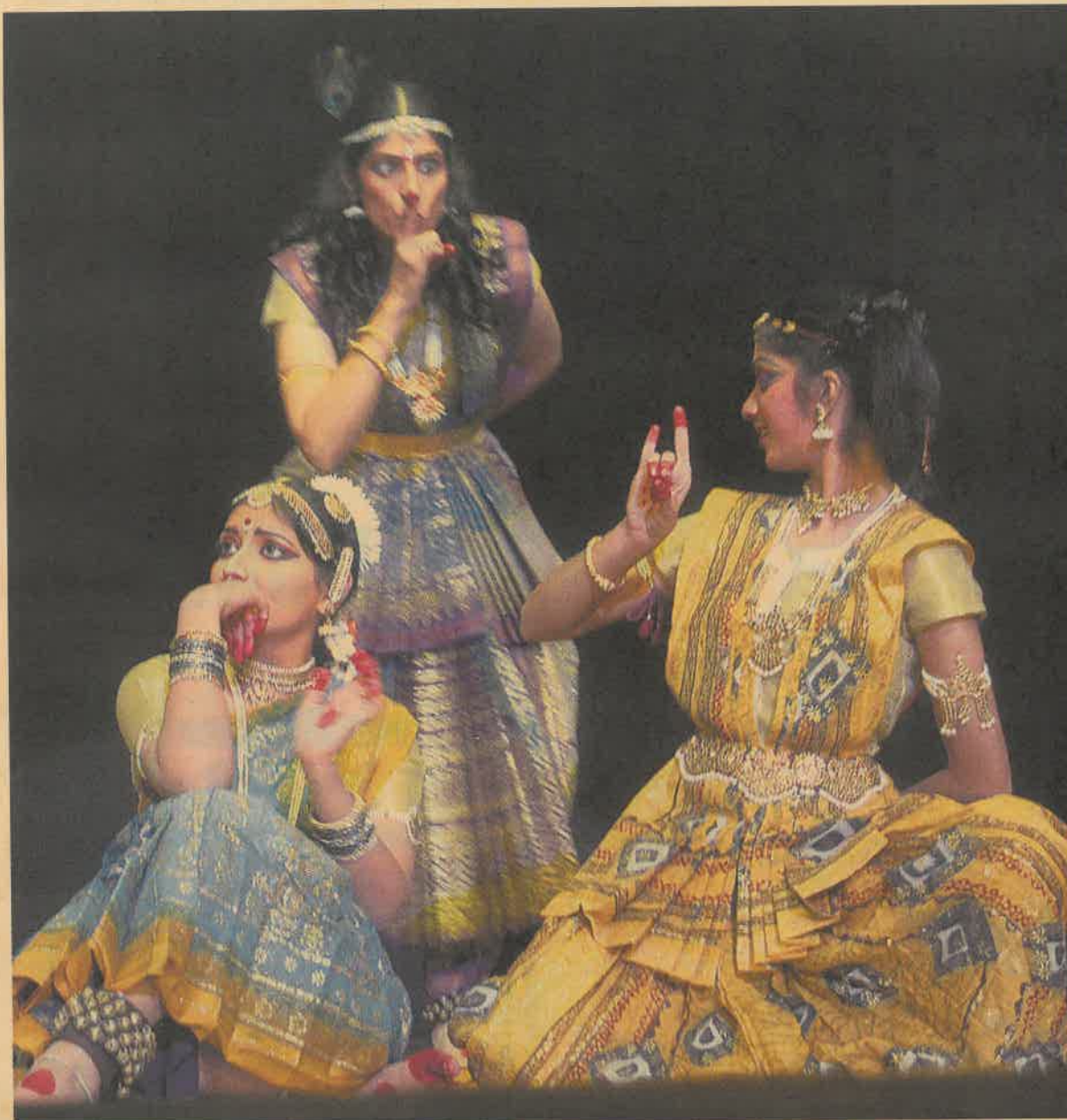
RAAS LEELA The illustrative dance ballet.