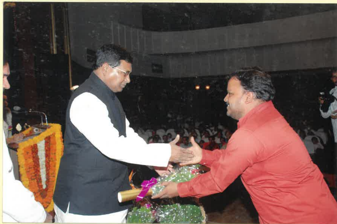
Hon. Home minister Sri Jana Reddy.