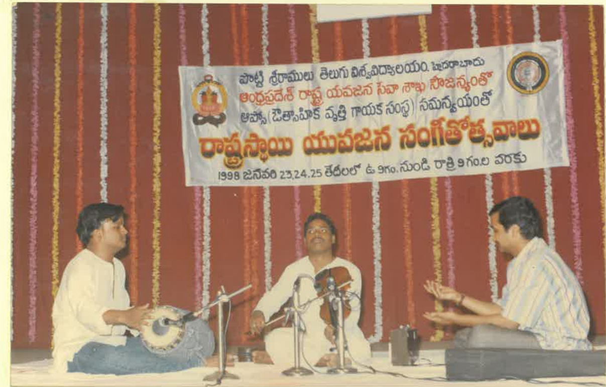
As a Mridangam player