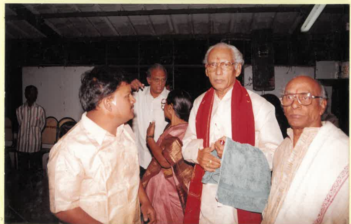
Padma Bhushan Vempati China Satyam.